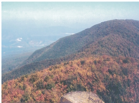
Chránená krajinná oblasť Vihorlat. Lesy v tejto oblasti majú padnúť za obeť projektu Biele kamene.

Kraj v malebnom prostredí krásneho pohoria s vidieckym nádychom je lákadlom pre rôzne zájmové skupiny a pochybných jednotlivcov. Boháči si postupne skupujú pozemky a snažia sa meniť krajinu podľa svojich predstáv nehľadiac na záujmy obyvateľov žijúcich priamo v nej. Ich prianím je krajina prispôbena západnej kultúre, kde neúcta k druhým a prírode, konkurencia, stres a nervozita určujú kolobeh dňa. Krajina, kde sa väčšina obyvateľov mení na tovar na predaj a prenájom. Prírodu nevynímajú.