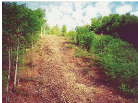
Národný park Poloniny. Kto má skutočný záujem na holoruboch? Takto (a omnoho horšie) môže onedlho vyzerat CHKO Vihorlat.

Tvorcovia zimného strediska sa bez hanby rozhodli zrealizovať ho priamo v CHKO Vihorlat. Ich zámerom by malo padnúť za obe 140 hektárov lesa, v ktorom sa vyskytujú vzácne a ohrozené druhy rastlín a živočíchov. Oblasť je pritom súčasťou siete území európskeho