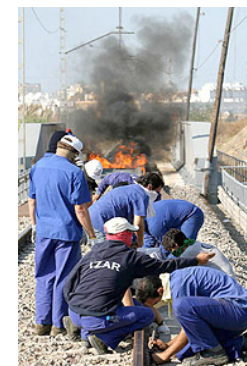
San Fernando, 27. 9. 2004