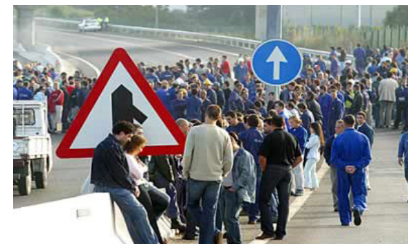
Demonštrácia vo Ferrole 21. 9. 2004

Pokojná demonštrácia 3 000 štrajkujúcich vo Ferrole vyústila do násilností, keď začali blokovať cesty k letisku. Hliadka jedného z vojenských objektov vo Ferrole hrozila použitím zbraní voči demonštrantom, ktorí na ňu hádzali rakety.