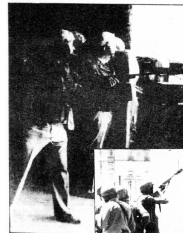
Odpoveď polície na protesty - obušky a slzotvorný plyn

Ja sám a ďalší kamaráti sme boli obvinení napríklad zo spôsobenia škody vo výške 15 až 20 milión pesiet. Mal som napichnutý telefón a podobne. Toto sa stalo mne a ďalším kamarátom. Išlo o konkrétnu snahu kriminalizovať členov CNT, zvlášť tých najviditeľnejších.