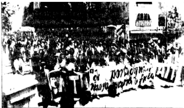
CNT na demonštrácii v uliciach Puerto Real

Začalo to tým, že jedna z nás si všimla, že sme prepracované a doliehajú na nás boje našich mužov, ktorí každý utorok konfrontovali políciu a dostávalo sa im represie v lodeniciach, zatiaľ čo médiá ich nazývali teroristami. Táto žena sa chytila iniciatívy a začala budovať kontakty so susedmi a priateľmi. Oni na oplátku pomohli tým, že sa skontaktovali s ďalšími skupinami žien a každý utorok vychádzali do ulíc s megafónom, aby demonštrovali a stretli sa s ďalšími ženami, ktoré pociťovali problém v lodeniciach. Boj v lodeniciach viedli muži, no nás to ovplyvňovalo rovnako ako ich. Nešlo ani tak o demonštrácie vyjadrujúce podporu, skôr to boli naše vlastné demonštrácie, pretože sme boli závislé od miezd mužov.