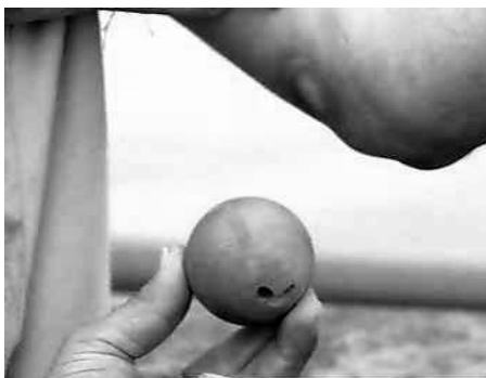
Gumová guľa a zranenie ramena, ktoré spôsobila (Puerto Real 6. 10. 2004)

17. septembra sa veľká skupina robotníkov pokúsila zablokovať most Centennial V v Seville, bola však vytlačená k lodeniciam útokom agresívnej poriadkovej polície, ktorá zranila najmenej 23 ľudí. Odpoveďou bola blokáda inej hlavnej cesty stojanmi na svietidlá a nábytkom z nákladiaka.