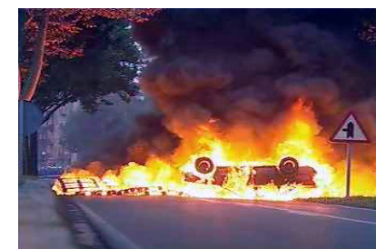
Sestao, 30. 9. 2004