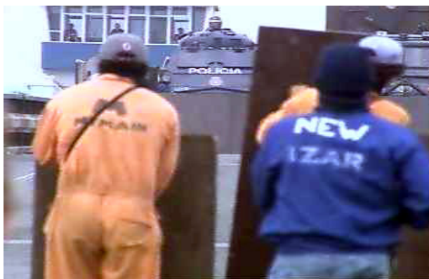
Puerto Real, 6. 10. 2004