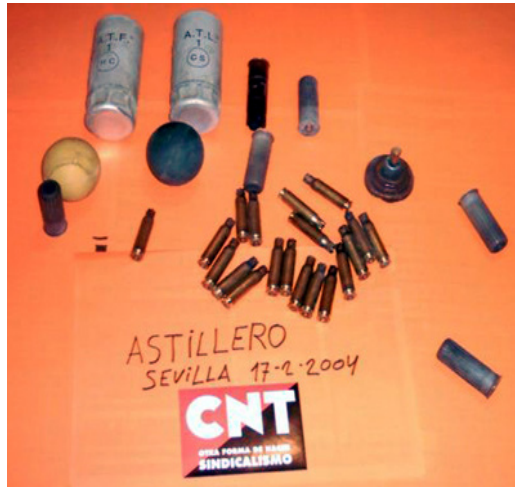
Použitá policajná munícia zozbieraná CNT Sevilla

skončia s trvalými následkami po zraneniach očí. Polícia prichádza v plnej zbroji, s chráničmi na celom tele, maskami, štítmami, obrnenými transportérmi, tajnými kamerami, tankami, vystreľovacími elektrickými paralyzérmi, brokovnicami... Nosia si úplne všetko. Potom nabehnú do továrne a začnú všetko ničiť: ničia ploty a stroje, ničia plechy áut, rozbíjajú na nich okná, strieľajú do nás a šíria strach. Ak by dostali rozkaz pozabíjať nás, urobili by to. Nikto nemôže povedať, že robotníci odpovedali rovnako. Jediní policajti, ktorí mali nejaké problémy, boli dvaja, ktorých odniekiaľ zasiahli rakety. Ale dobre vieš, že to sa proste stáva. Musíme si byť na čistom: my sme pracujúci využívajúci naše práva: právo na štrajk, právo demonštrovať a vyjadrovať sa, právo na prácu, právo na organizovanie sa v odboroch a právo žiť dôstojný život. Tí, ktorí používajú násilie, aby nám upreli tieto práva, sú zástupcami štátu. Obranu týchto práv nepovažujem za násilie.