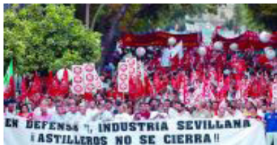
Sevilla, 5. 10. 2004