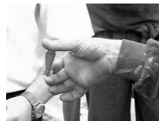
Puerto Real, 6. 10. 2004

Pracujúci v Puerto Real bojovali proti obrneným transportérom polície, ktorá zastavila ich pochod do Cádiz.