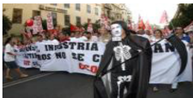
Sevilla, 5. 10. 2004