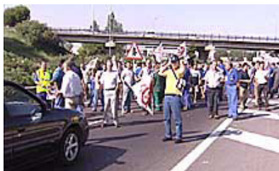
Manises, 30. 9. 2004

V San Fernande prišiel 38-ročný muž o oko počas ďalšieho ostrého boja pri lodeni- ciach. Zasiahla ho policajná strela zo vzdialenosti asi 60 metrov. Zasiachnutý bol v areáli továrne. Sanitku, ktorá ho mala odvieť do nemocnice, zablokoval obrnený transportér, ktorý bol úmyselne zaparkovaný pred bránou lodenice.