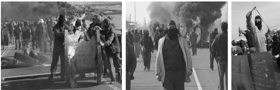
18. február 2004 v Puerto Real

38 štrajkujúcich utrpelo zranenia po tom, ako polícia spustila paľbu gumovými projektilmi a použila slzotvorný plyn na demonštráciu pri bráne do lodeníc v Seville. Ako barikáda bola použitá zapálená dodávka.