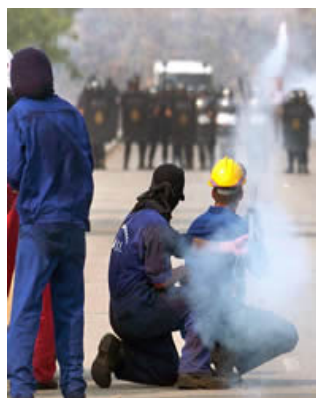
Sevilla, 6. 10. 2004

detailný opis a vysvetlenie všetkých udalostí. Niektoré sú iba spomenuté a nevieme ako sa vyvinuli. Práve túto otvorenosť považujeme za jednu z najväčších hodnôt. Dúfame, že sa stane podnetom pre TVOJE vlastné úvahy.